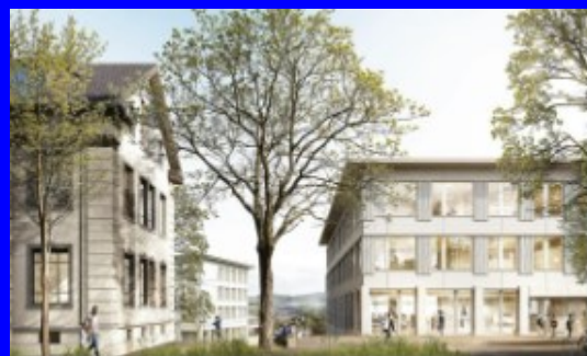
Schulhaus Triemli, In der Ey *