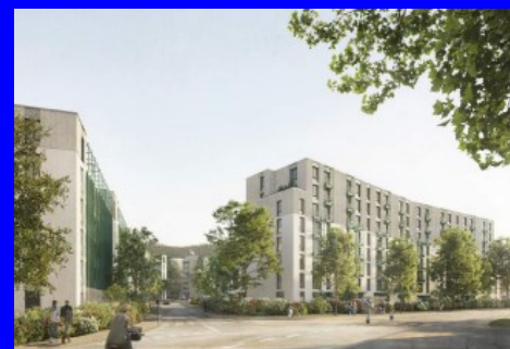
Gen. GBL Langgrütstr.