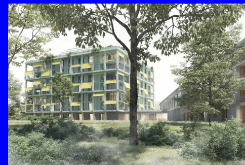
Gesundheitszentrum Bachwiesen *