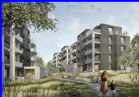
Breiti, Bachwiesen, Gen. Zurlinden