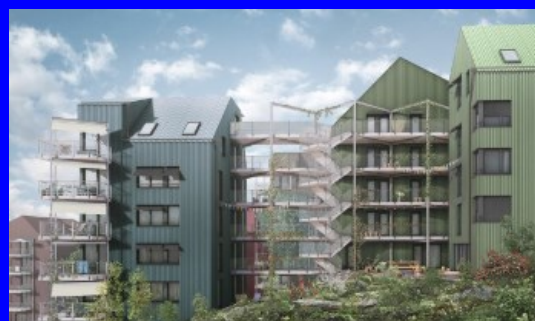
Triemli, Villy, Gen. Sonnengarten *